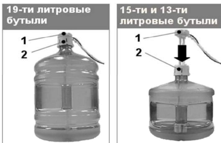
Рис.2 Установка сифона на бутылки с водой